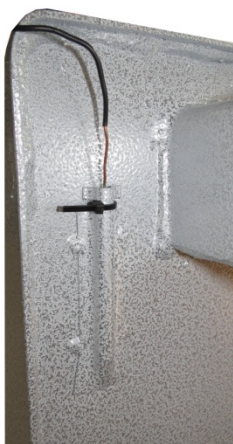
Рис.1. Пример установки баллона терморегулятора в гильзе котлов КАРАКАН

Окружающая среда - невзрывоопасная, не содержащая агрессивных газов и паров, токопроводящей пыли.